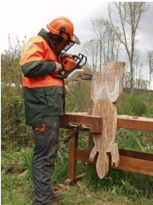
„Loufest im Kiischpelt“