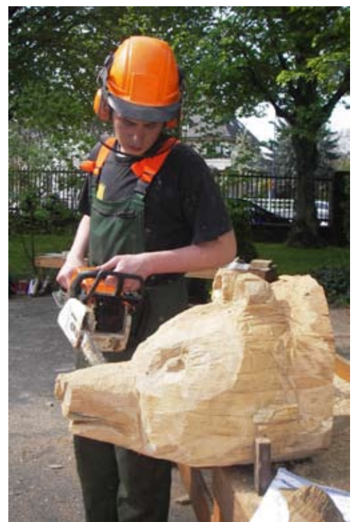
Seit 2005 ist eine Tendenz zu Tierfiguren zu erkennen