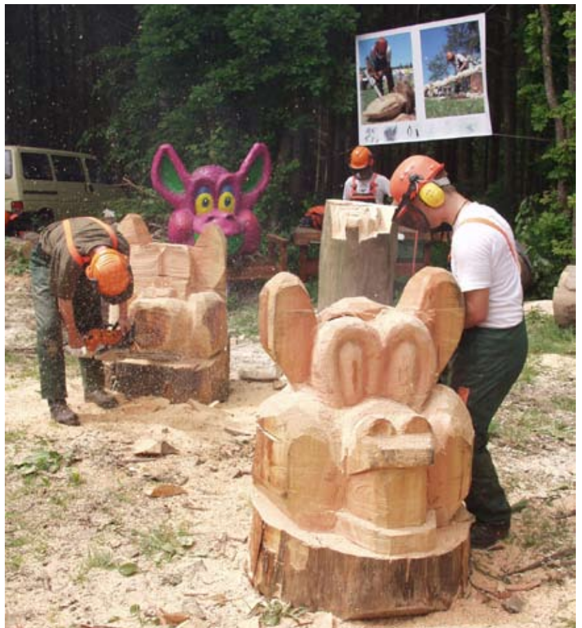
Ausnahmsweise wird hier nach einem Modell gearbeitet

Bei Ausflügen wie z.B. zum Weltkulturerbe „Völklinger Hütte“ und zum Saarlandmuseum hatten die Mitglieder des „Schnëtzcoures“ die Gelegenheit sich, neben dem Besuch des Technischen Museums, durch die Werke großer Künstler wie David Nash, Werner Pokorny und Duane Hanson inspirieren zu lassen.