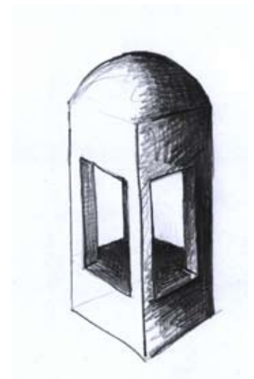
Skizze und verschiedene Modelle der Übung 3

Als Hauptziel des Kurses sollen die Schüler dann nach einigen Pflichtübungen eine Holzskulptur nach ihrem eigenen Entwurf realisieren. Dazu gehört sowohl das Anfertigen einer Skizze als auch die Beschaffung des erforderlichen Rohmaterials im Wald. Waren es am Anfang hauptsächlich abstrakte Formen, die die Schüler geschnitzt haben, so ist seit zwei Jahren eine klare Tendenz zu Tierfiguren zu erkennen.