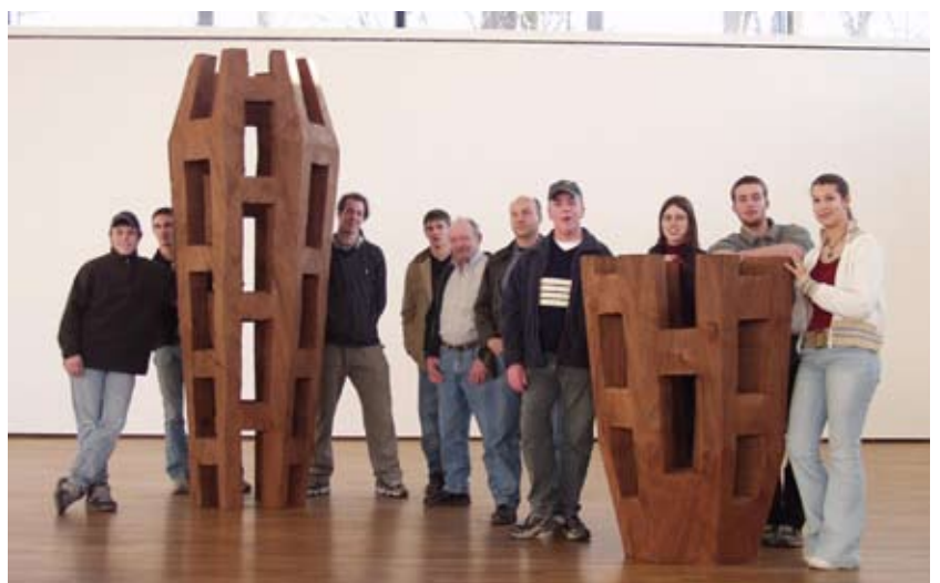
Besuch der Ausstellung des Bildhauers Werner Pokorny im Saarlandmuseum Saarbrücken