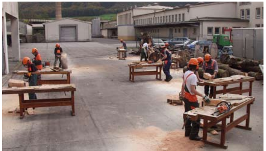
Das LTArt-Atelier auf dem Gelände der Laduno in Ingeldorf

Außerdem hatten die Schüler die Möglichkeit, ihre Werke im Tunnel (CAPEL) in Luxemburg-Grund, bei einer Vernissage im Festsaal des LTA sowie bei einer Ausstellung im CACTUS Ingeldorf der breiten Öffentlichkeit vorzustellen.